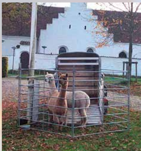
Alpaca-besøg til vintermøde