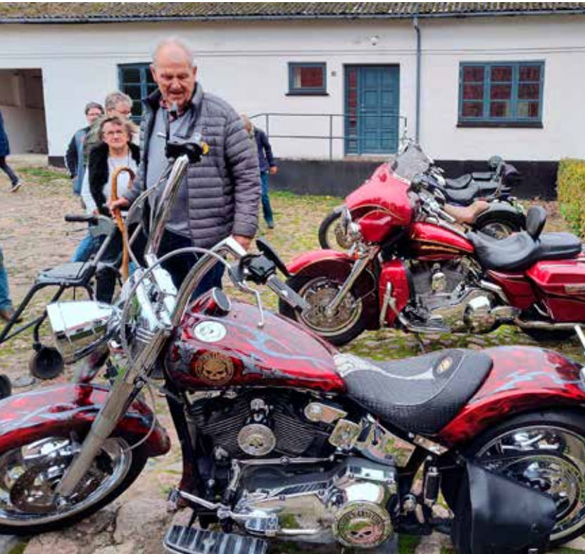
Højskoledag: Det er bare mænd! Vi sparker til dæk.