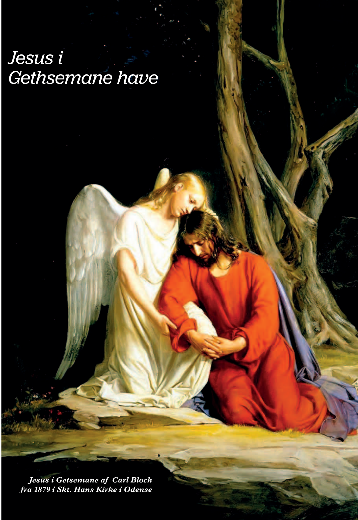
Jesus i Gethsemane af Carl Bloch fra 1879 i Skt. Hans Kirke i Odense

Livets er fuld af intensitet, for mig er små valg ligeså vigtige som store, fordi de tilsammen skaber noget enten stort godt eller stort ondt. Det vi fodrer hver dag, er det som for lov til at leve stærkest i os. Jeg tror, at Jesus valgte at give sig selv som et offer den nat, fordi han allerede havde truffet det valg igen og igen, når han helbredte og gjorde godt for dem han mødte. Alle vores små valg skaber en sti, som når vi står over for de store valg, gør det muligt at vi træffer det bedste valg,